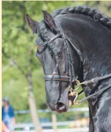
Friesenhengst im Bewusstsein seiner Persönlichkeit

In der heutigen Zeit ist die Bedeutung des Barockreitens eine andere. So genannte Barockpferde sind Andalusier, Lipizzaner, Lusitanos und Friesen. In Spanien, Italien und Portugal wird diese Art der Reiterei noch gepflegt. Die Piaffe und Passage sind Elemente der hohen Schule und zirzensische Lektionen wie das Kompliment oder der Spanische Schritt gehören auch zu dieser Reitweise.